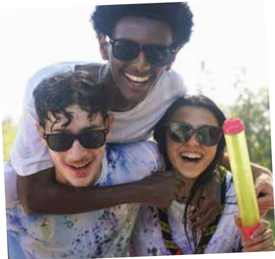
Day Camp Adventure i Skärholmen.