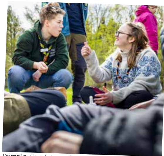
Demokratiworkshop på Lovön.