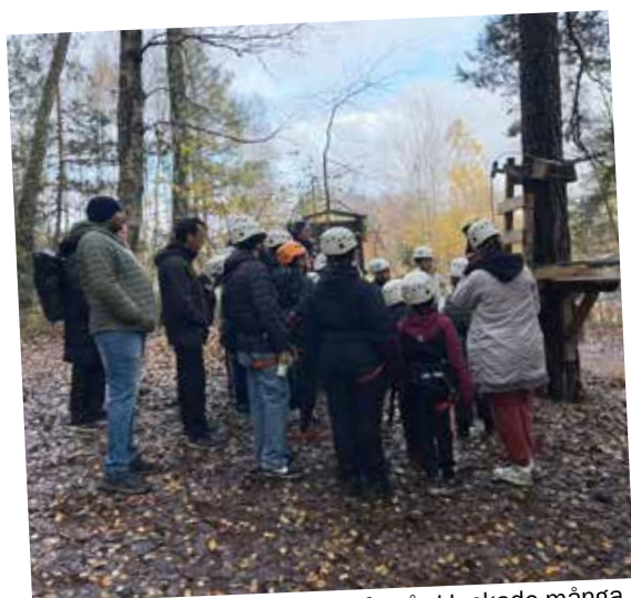
Höghöjdsbanan vid Lida friluftsgård lockade många.